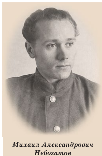
Михаил Александрович Небогатов

отдавал военным мемуарам. После него осталось множество книг по художественному изобразительному искусству, архитектуре. Дедушка и стихи писал, у нас сохранилось несколько его авторских сборников в электронном виде (книжки свои он раздавал). В основном это военная лирика.